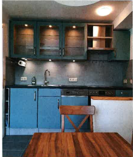
Küche mit integrierter Waschmaschine