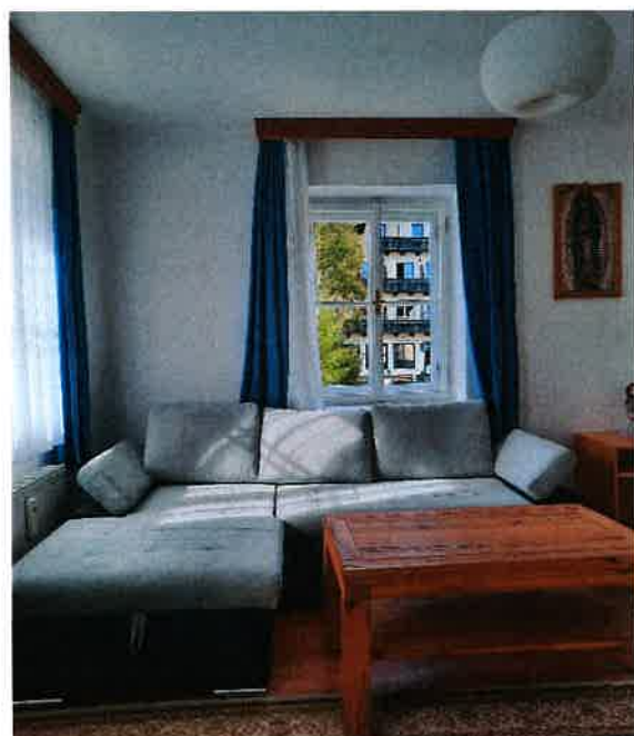
Wohnzimmer mit Blick auf den Dorfplatz