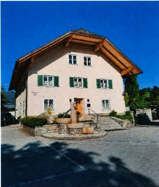
Pfarrhof am Dorfplatz