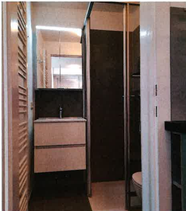
neuer Sanitärraum mit Dusche und WC