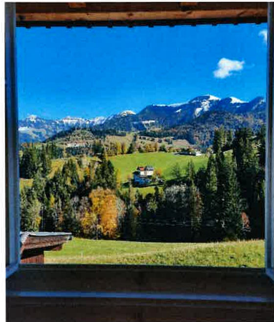
Panoramaausblick vom Schlafzimmer